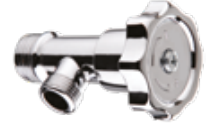
S-61015 Lüks Taharat Musluğu Cıvalı (Blister Ambalaj Koli Adedi