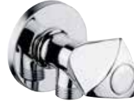
S-01074 Hilal Dekoratif Ara Musluk (Blister Ambalaj Koli Adedi