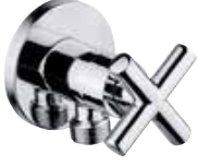
S-01071 Star Dekoratif Ara Musluk (Blister Ambalaj Koli Adedi