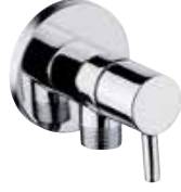
S-01070 Judi Dekoratif Ara Musluk (Blister Ambalaj Koli Adedi