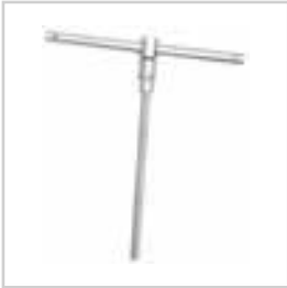
SERVİS TE BORU DELME ANAHTARI