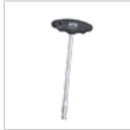
SERVİS TE BORU SIKMA ANAHTARI