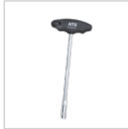
SERVİS TE BORU SIKMA ANAHTARI