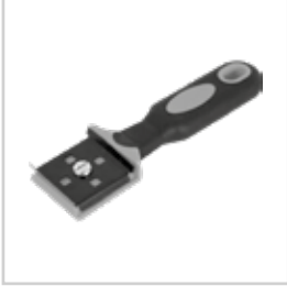
EL TİPİ BORU KAZIYICI